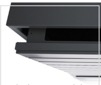
mechanizm samozamykający „domyk”